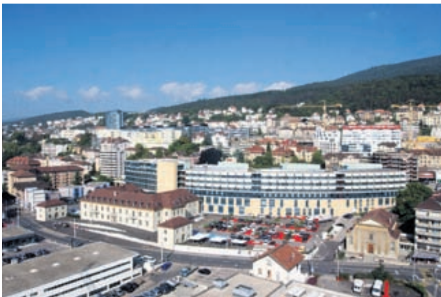
Neufs bâtiments de la zone concernée par le projet Holistic seront suivis par des contrats Energho, à l'exemple de l'Hôpital Pourtalès.

S'il est évident qu'une partie des mesures conseillées dans le cadre des procédures Energho sont du ressort d'experts, un certain nombre d'entre elles peuvent être appliquées immédiatement par un concierge. La chaudière peut être arrêtée manuellement en été et à mi-saison. On évitera ainsi que le chauffage se mette en route automatiquement pour quelques heures froides alors que le bâtiment est en mesure de tempérer cette baisse de température. De même, une bonne