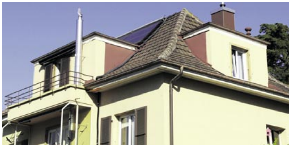
Les travaux de rénovation menés par étapes dans cette maison familiale, ont permis, avec peu de moyens, de réduire sa consommation en énergie de 60 à 70%.

Les 18 projets Concerto, dont fait partie le projet Holistic, ont également comme vocation de favoriser les échan-